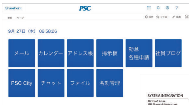
PSC様の社内ポータルサイト

Coltのコネクティビティは非常に優れており、世界中の業界トップのインターネットエクスチェンジと容易につながる点にも魅力を感じております。Coltのデータセンターは、事前にプロビジョニングされたコネクティビティを持つ巨大なバーチャルキャンパスのように動作するので、Microsoft AzureやAWSを含めたクラウドにおいて顧客が相互に接続することも容易です。また、15年以上に渡るデータセンターの設計、構築、運用をしてきた経験は業界トップの品質を実現しており、非常に高度な信頼性と回線の接続性が要求される金融や証券サービス、ミッションクリティカルな業界が利用していることもその答えであると言えます。